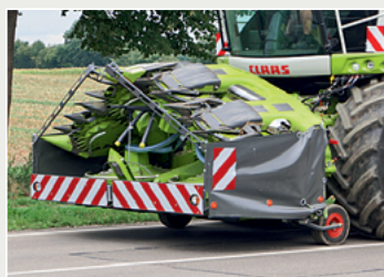
Das Orbis 600 SD ist jetzt mit neuer Klappung und Fahrwerk unterwegs.

Beim Achtreiher 600 SD (Small Disc = kleine Scheiben) setzt Claas ebenfalls auf den Pendelrahmen mit der neuen Unterkonstruktion. Damit gilt für das 6-m-Orbis das Gleiche beim Schnitt und Gutfluss wie beim Orbis 750. Statt serienmäßigem Feder-Querausgleich ist Auto Contour optional an Bord. Neu ist die V-förmige Klappung über den Totpunkt für eine bessere Sicht. Ebenfalls neu für das 3 t schwere Orbis 600 SD ist das integrierte Fahrwerk, mit dem die Vorderachslast des Häckslers von 11,5 t eingehalten wird.