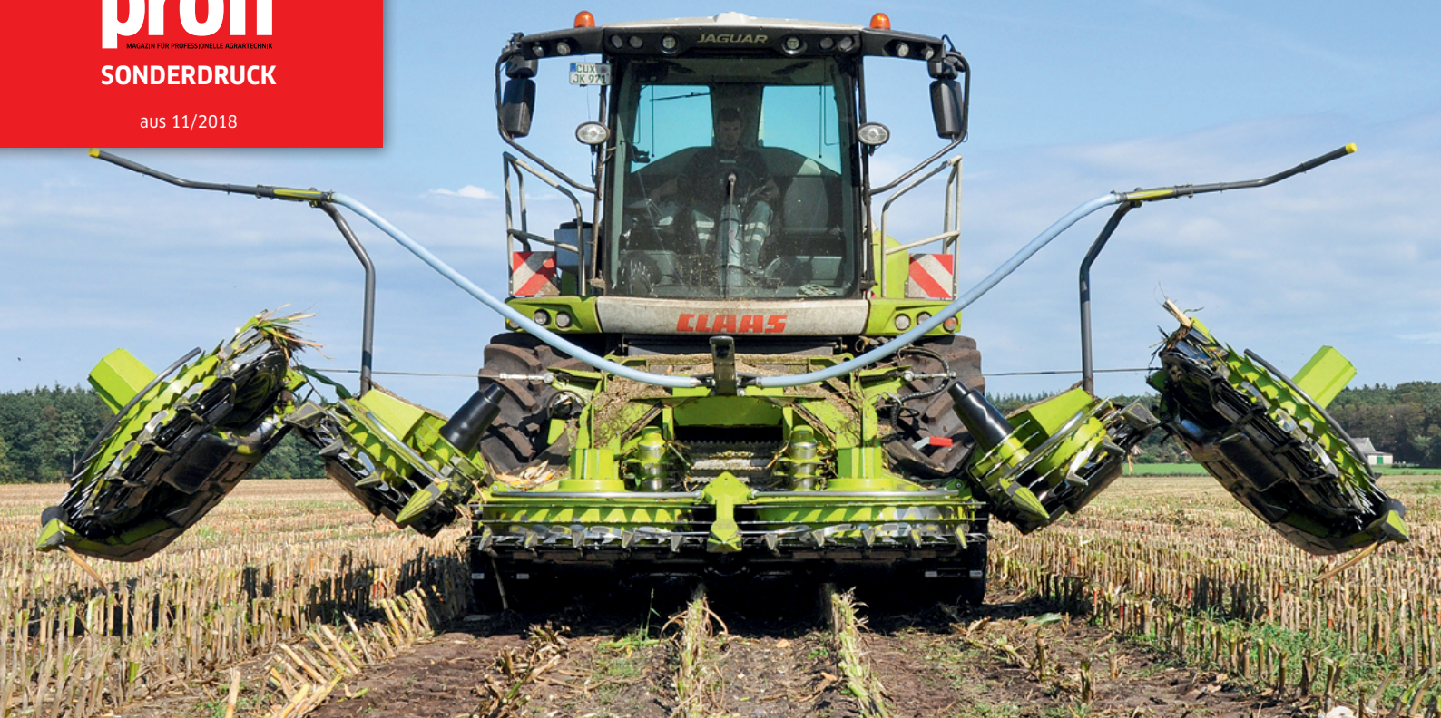
Beim neuen Orbis 750 klappen die Seiteneinheiten symmetrisch und schnell übereinander.