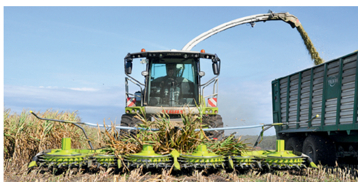
Sauberer Gutfluss und kurze Stoppel: Am neuen Orbis hat sich eine Menge getan.

Nicht immer ist eine neue Rahmenbauart unmittelbar für das Arbeitsergebnis interessant. Beim Orbis schon, denn die jetzt rundgeformte und pressgehärtete Konstruktion des Unterbodens wirkt sich nicht nur auf die Festigkeit, sondern auch auf die Arbeitsqualität aus. Der Schnittwinkel zum Boden ist deutlich flacher, so dass nun gleichmäßigere und vor allem kürzere Stoppelhöhen möglich sind. Bis auf 8,5 cm reichen die Messer an den Boden – so sollte das Orbis jetzt auch bei der Ganzpflanzensilage besser abschneiden. Die Schnitthöhe kann per Auto Contour von 10 bis 30 cm gewählt werden. Mit wenig