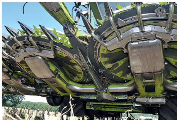
Durch die veränderte Rahmenbauweise ist der Schnittwinkel gerader. In die abgerundeten T-Konsolen sind die Getriebe gebettet.